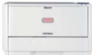
C310dn nettverk og duplex