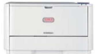
C330dn nettverk og duplex